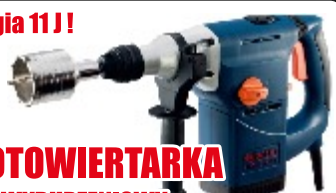
MŁOTOWIERTARKA MŁOT WYBURZENIOWY HR3-1200