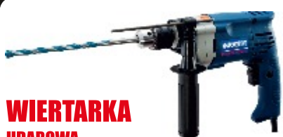
WIERTARKA UDAROWA HD10-13-RE