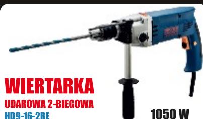
WIERTARKA UDAROWA 2-BIEGOWA HD9-16-2RE