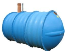
Zbiorniki jednokomorowe o średnicy 1,45 m Wymiary: (długość [m] / waga [kg] )