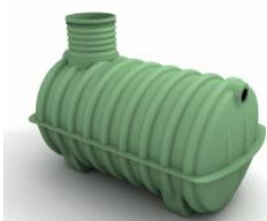
Zbiorniki jednokomorowe o średnicy 1,6 m Wymiary w [m]: (długość / wysokość / szerokość / wys. wjazdu)