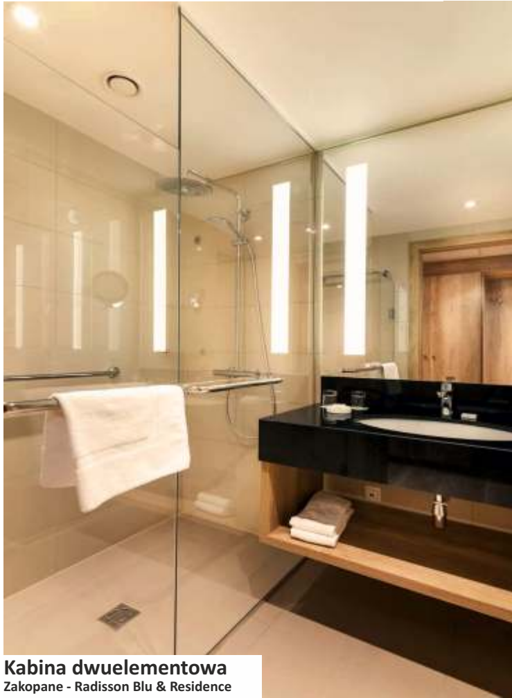
Kabina dwuelementowa Zakopane - Radisson Blu & Residence