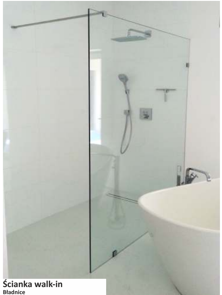
Ścianka walk-in Bładnice