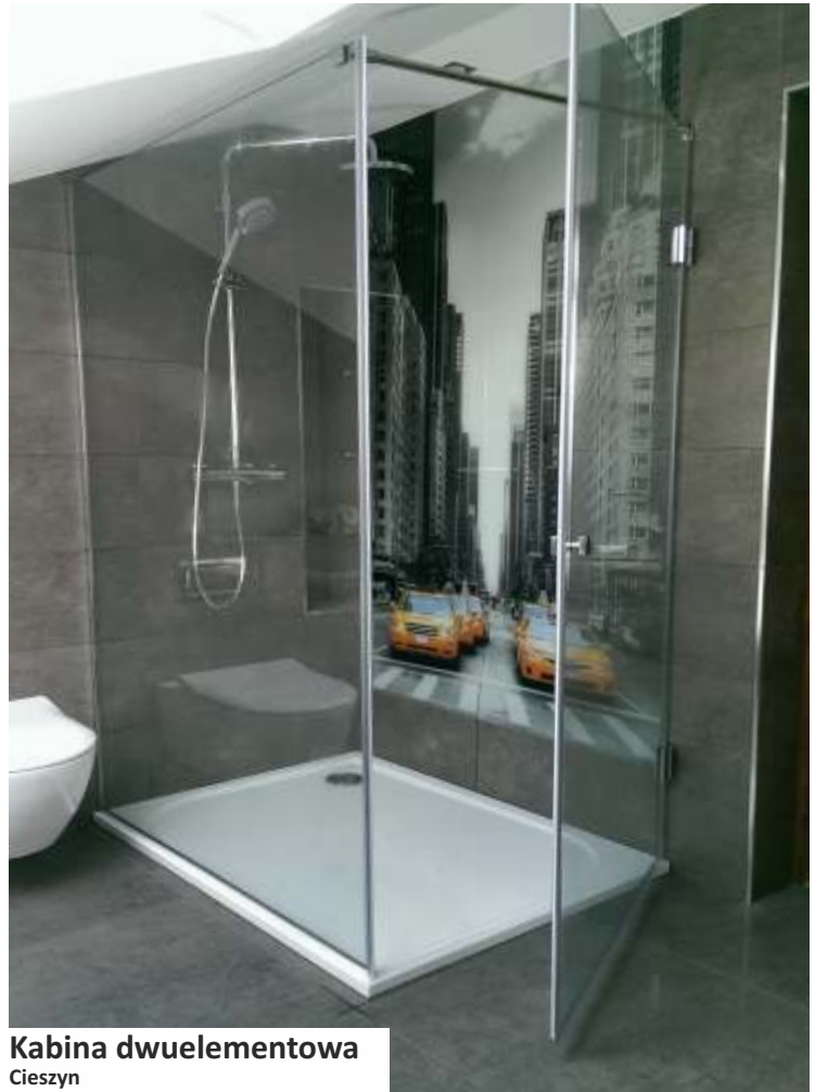
Kabina dwuelementowa Cieszyn