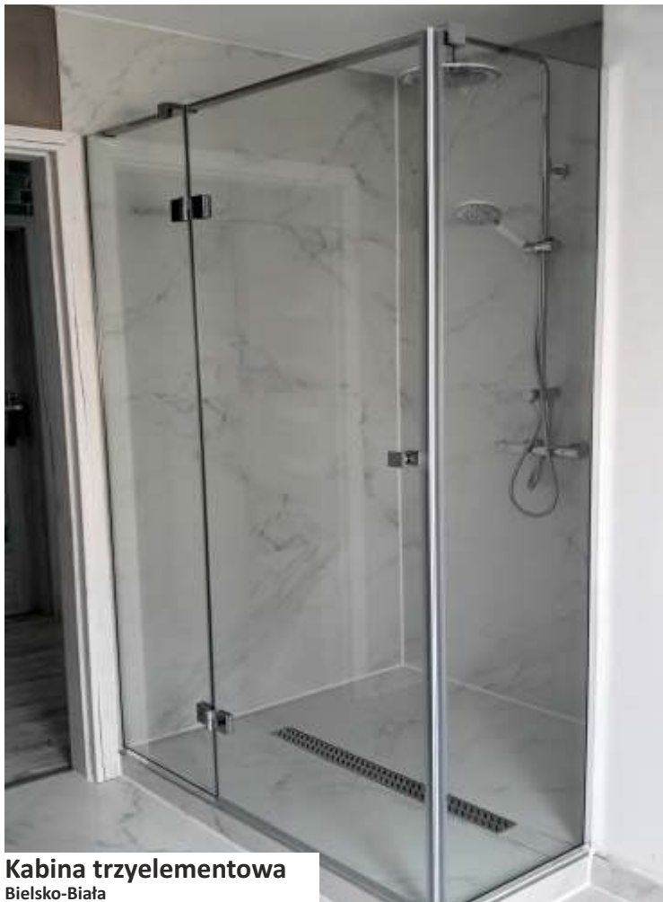
Kabina trzelementowa Bielsko-Biala