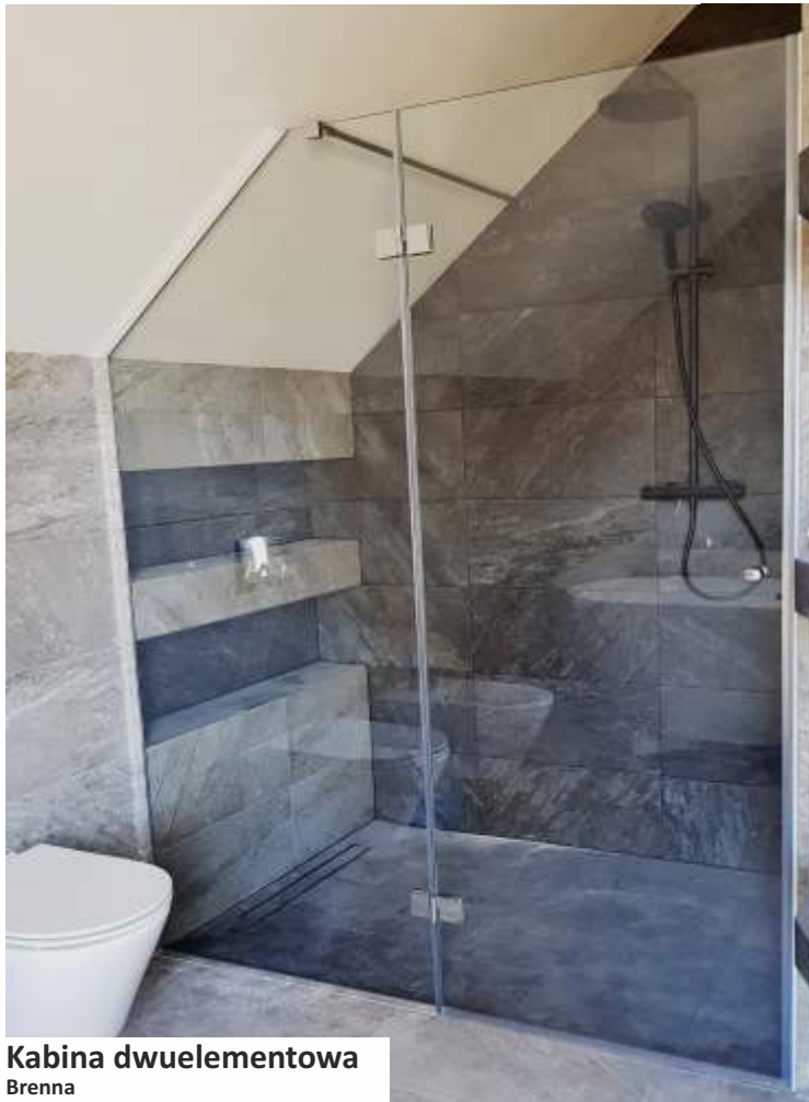
Kabina dwuelementowa Brenna