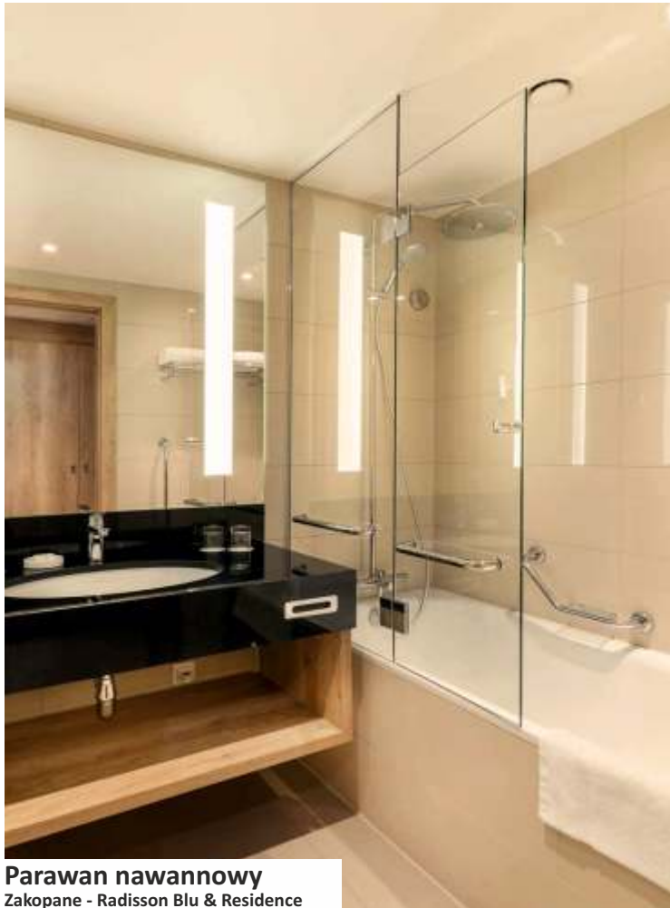
Parawan nawannowy Zakopane - Radisson Blu & Residence