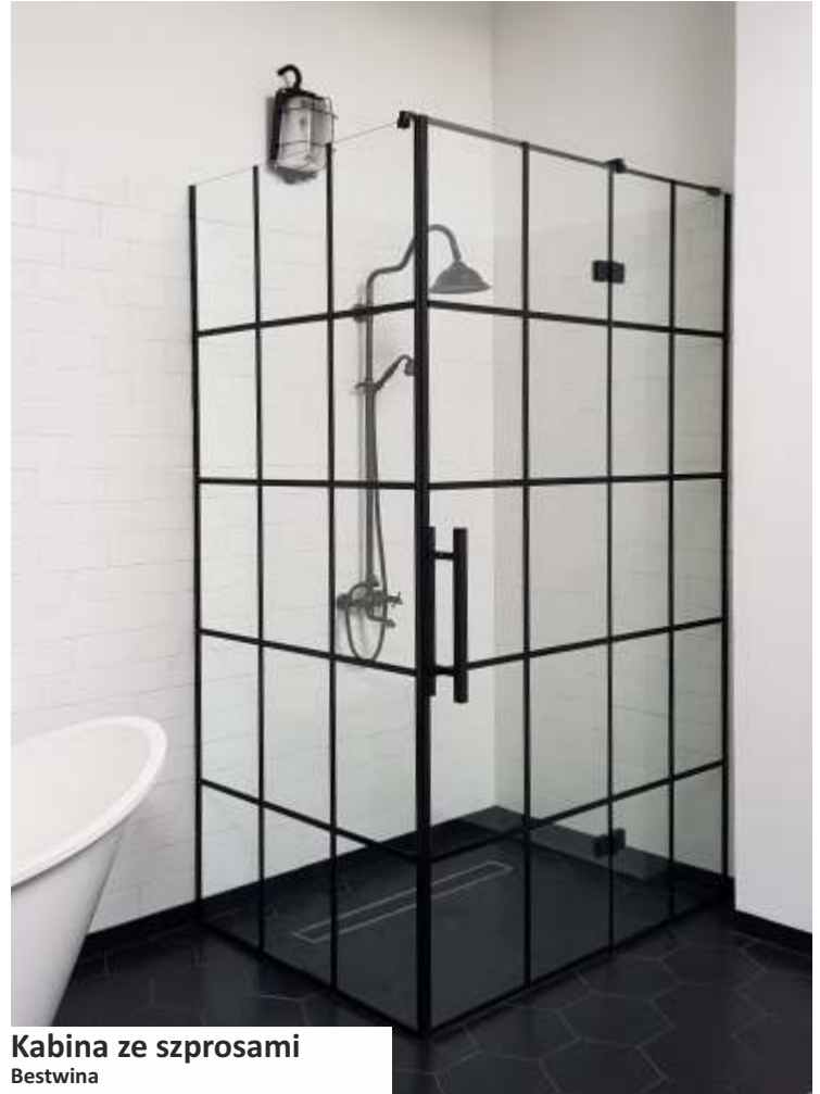
Kabina ze szprosami Bestwina