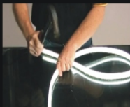
Odporność na uderzenia