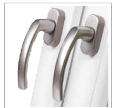
antywłamaniowe klamki w standardzie

Każde okno Econo 86 zostało wyposażone w standardzie w innowacyjną technologię Super Spacer® , gwarantując swoim użytkownikom najwyższe parametry użytkowe.