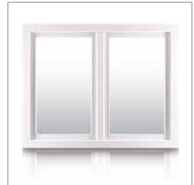
piękno i trwałość konstrukcji

Szara uszczelka dla okien białych w standardzie – podkreślenie idealnej kompozycji i wyjątkowego wyglądu okien.