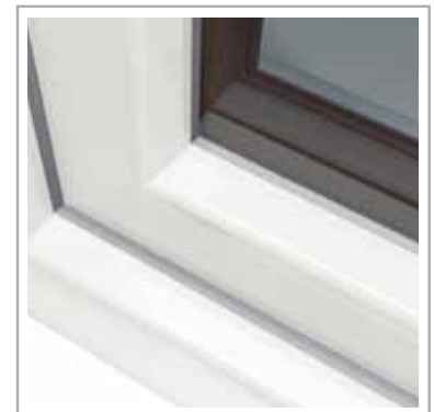
estetyczna i żywotna uszczelka